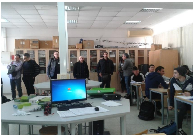
Επίσκεψη σε τάξη