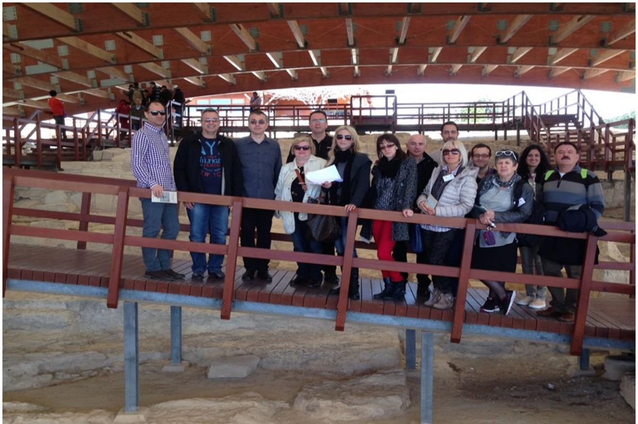
Εκδρομή στον αρχαιολογικό χώρο Κουρίου Επισκοπής